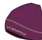
ART. X88 501501 PLUM