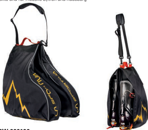
ART. 49W 999100 BLACK / YELLOW