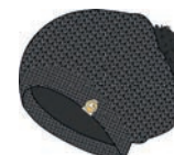
ART. X98 900900 CARBON