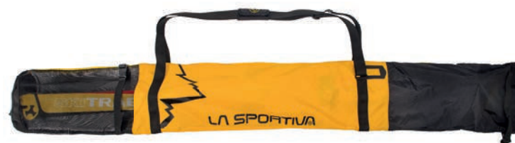
ART. 49V 999100 BLACK / YELLOW