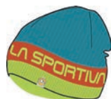
ART. X74 614705 TROPIC BLUE / APPLE GREEN NEW