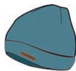
ART. X85 607607 LAKE