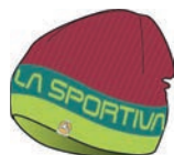
ART. X74 308705 GARNET / APPLE GREEN NEW