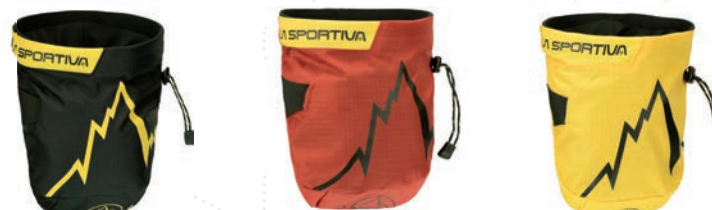
ART. 39C BK BLACK

Classic climbing chalk bag, lightweight and long lasting, with integrated regulation system and waist-clip.