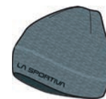
ART. X88 903903 SLATE