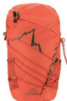
ART. 29X RE RED