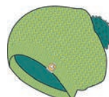
ART. X98 705608 APPLE GREEN / EMERALD