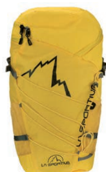
ART. 29X YE YELLOW