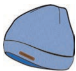
ART. X85 613613 COBALT BLUE