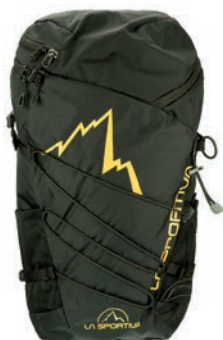
ART. 29X BK BLACK