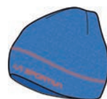
ART. X88 613613 COBALT BLUE