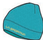
ART. X88 614614 TROPIC BLUE