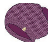
ART. X98 501501 PLUM