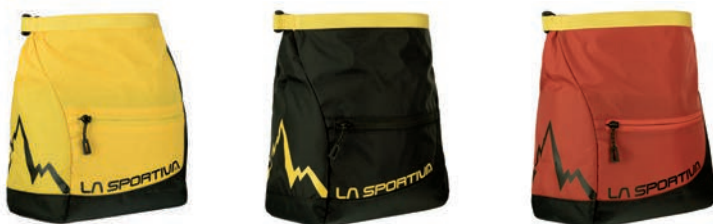
ART. 39B YE YELLOW

Large, sturdy and capable boulder bag with integrated zip pocket for rock-brush and little object.