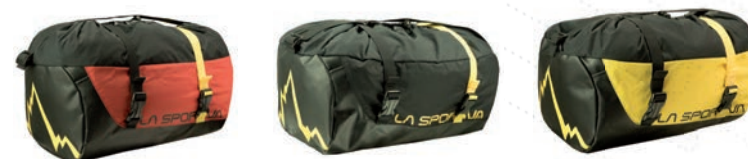
ART. 39D RE RED

Durable and lightweight rope bag with integrated removable cloth for dust protection. Integrated inside pocket and soft shoulder strip.