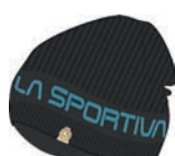
ART. X74 900900 CARBON NEW