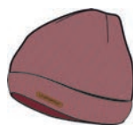
ART. X85 307307 CARDINAL RED