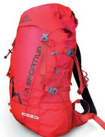
ART. 39G RE RED