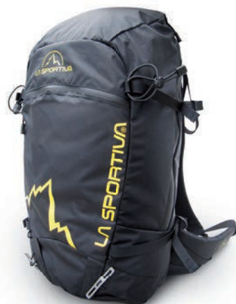
ART. 39E BK BLACK