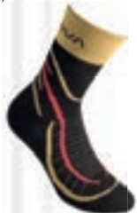
ART. 490 999100 S BLACK / YELLOW

Offizielle Socke des La Sportiva Mountain Running® Teams, mit ATHELTICFIT Technologie und entwickelt für Performance-Einsätze: bietet super anliegenden Fit für maximale Sensibilität und Präzision der Bewegungen. Er wird aus super leichter Dryarn® Mikrofaser hergestellt, die sehr resistent ist und stets für trockene Haut sorgt.