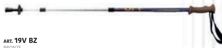
ART. 19V BZ BRONZE