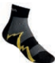
ART. 29U BY S BLACK / YELLOW