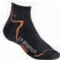
ART. 29T 999304 S BLACK / FLAME