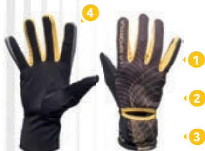
ART. X54 999100 BLACK / YELLOW