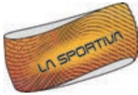
ART. X51 999100 BLACK / YELLOW

Race Stirnband als Windschutz oder gegen den Schweiß, komfortabel und atmungsaktiv: unabdingbares Accessoires für jeden Runner im Wettkampf oder während des Trainings. Grafik mit Sublimationsdruck, perfekt in Linie mit dem Gesamtlook der Mountain Running Race Linie.