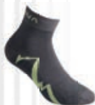
ART. 29U 900705 S CARBON / APPLE GREEN

Superleichte, ergonomische Socke für leichte Trainingseinheiten und den Alltag.