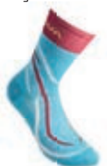
ART. 490 602303 S MALIBU BLU / BERRY