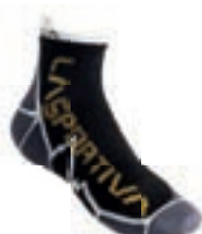
ART. 29S BY S BLACK / YELLOW