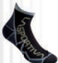
ART. 29S 900705 S CARBON / APPLE GREEN

Diese Socke wurde für lange Laufstrecken im off-road Gelände, Wettkämpfe und lange Trainingseinheiten entwickelt.