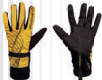
ART. Y02 100999 YELLOW / BLACK