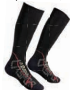
ART. 39Y WB S WHITE / BERRY

Komfortable Passform für das Skitourengehen vorwiegend des Tourings und ideal für vielstündigen Einsatz: Entwickelt um optimalen thermischen Komfort, Atmungsaktivität und Langlebigkeit zu garantieren. Vereint perfekt Passform und technische Leistungsfähigkeit.