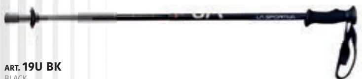
ART. 19U BK BLACK