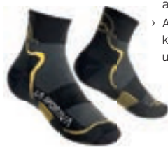
ART. 29T BY S BLACK / YELLOW