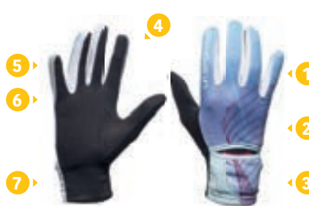
ART. X55 602303 MALIBU BLU / BERRY