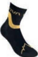
ART. 59W 999100 BLACK / YELLOW

Diese Socke wird zu 100% in Italien hergestellt. Die weiche und thermoregulierende extra-feine Merinofaser eignet sich hervorragend für Laufsocken im Winter. Die natürlichen Fasern sind sehr resistent und ermöglichen eine sehr dünne Verarbeitung, die gleichzeitig auch sehr warm ausfällt. Snowrun Socks wird dank des hohen Bündchens und der atmungsaktiven Eigenschaften der Wolle zur natürlichen Wahl für Läufer in den Herbst- und Wintermonate werden.