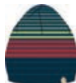
ART. Y28 712618 CITRUS / OPAL