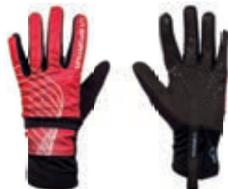
ART. Y03 303000 BERRY / WHITE