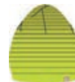
ART. Y28 713712 KIWI / CITRUS