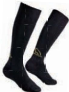
ART. 39X BY S BLACK / YELLOW

Top Socke aus extrafeiner Seide für den anspruchsvollen Skitourengeher und dem Wettkampfläufer. Sitzt perfekt am Fuß für maximale Stabilität und maximale Leichtigkeit. Garantiert außerordentliche Sensibilität.