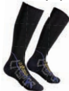
ART. 39Y YB S YELLOW / BLUE