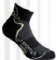
ART. 29T 999705 S BLACK / APPLE GREEN

Leichte Laufsocke zur Fortbewegung auf jedem Untergrund. Geeignet auch für lange Strecken bei hohen Temperaturen.