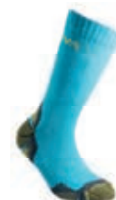
ART. 59F 614106 TROPIC BLUE / LEMONADE