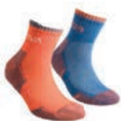
ART. 59E 203203 LILY ORANGE