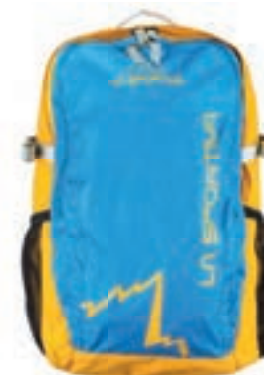
ART. 49P 600100 BLUE / YELLOW