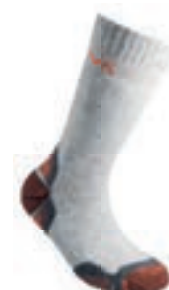
ART. 59F 900203 CARBON / LILY ORANGE