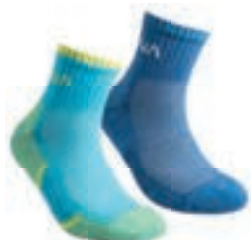
ART. 59E 600600 BLUE

Fabric: 75% Organic Cotton, 20% Polyamide, 5% Elastane Packaging: Bipack Sizes: XS/S/M/L/XL