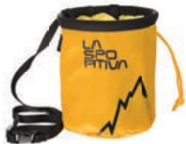
ART. 590 100100 YELLOW

Kleinerer Magnesiabeutel für Kinder und Jugendliche.