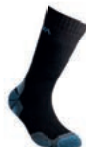
ART. 59F 999612 BLACK / MARINE BLUE

Fabric: 85% Organic Cotton, 10% Polyamide, 5% Elastane Sizes: XS/S/M/L/XL