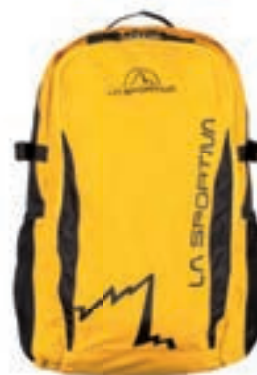
ART. 49P 100999 YELLOW / BLACK